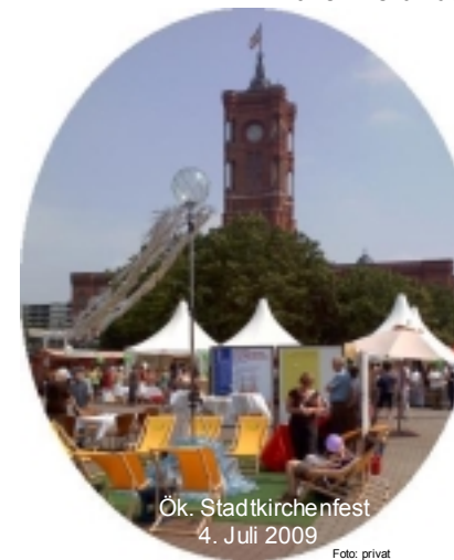
Ök. Stadtkirchenfest 4. Juli 2009